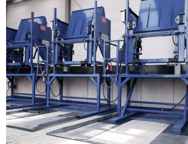
Stationäre Hub-Kipp-Vorrichtung in Rampenmontage