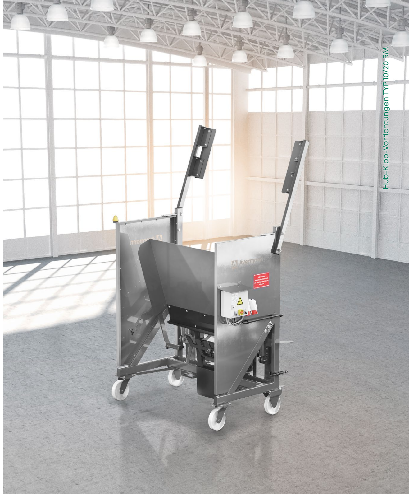
Hub-Kipp-Vorrichtungen TYP 10/20 RM

Telefon +49 5405 505 - 0 . Telefax +49 5405 6441 info@avermann.de . www.avermann.de